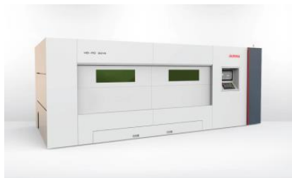
HD-FO оптоволоконный лазер