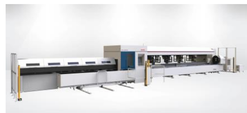
HD-TC лазер для резки труб и профиля

Нажмите на картинку и пройдите по ссылке для получения полной информации Nordcity.ee