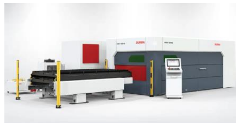
HD-F оптоволоконный лазер