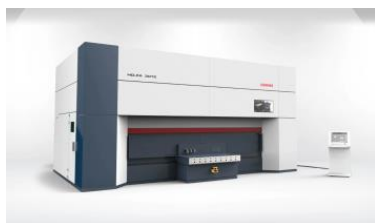
HD-FA 5-осевой лазер