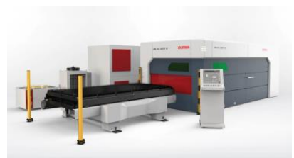
HD-FL оптоволоконный лазер