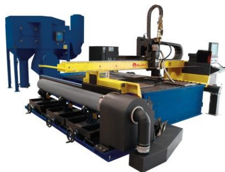
Комбинированная установка плазменного раскроя листового металла и труб AJAN.

Нажмите на картинку и пройдите по ссылке для получения полной информации Nordcity.ee