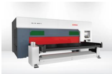
HD-FS портативный оптоволоконный лазер